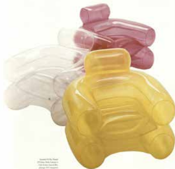
Designed by the author ©1998 by the author All rights reserved Published by the author All other content Copyright 1998

A) Spending time with each other outside of meetings and rituals; get together in pairs or trios for lunch, movies, hikes or other social and recreational activities.